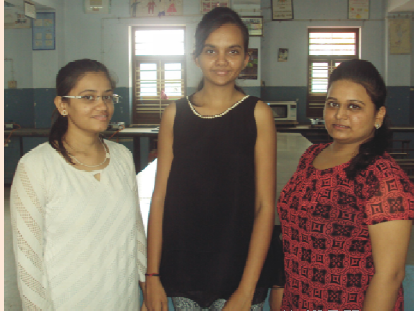
કુ. અરવા એન્ડ ગુપ એસ.વાય.બી.એસ.સી. (હોમ) પ્રથમ ક્રમાંક