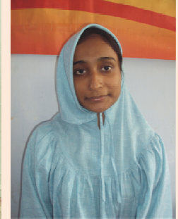
કુ. મીરાંઉમેસાલમા એસ.વાય.બી.એસ.સી. (હોમ) તૃતીય ક્રમાંક