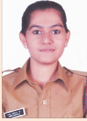
કુ. સાહિસ્તા સપા એસ.વાય.બી.એસ.સી. (હોમ) મ્યુઝીકલ ગેર દ્વિતીય ક્રમાંક